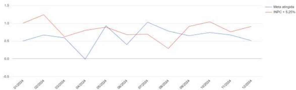
Gráfico - Rentabilidade x Meta (mês a mês)

O gráfico "Meta x Rentabilidade (mês a mês)" ilustra que, ao longo do ano, a rentabilidade obtida pelo Fundo oscilou, ficando abaixo da meta em diversos meses, o que se refletiu no resultado final. Essa performance anual aquém do esperado sinaliza a necessidade de revisão das estratégias ou das premissas para a política de investimentos para os próximos períodos, a fim de buscar o alinhamento com a meta atuarial do Fundo.