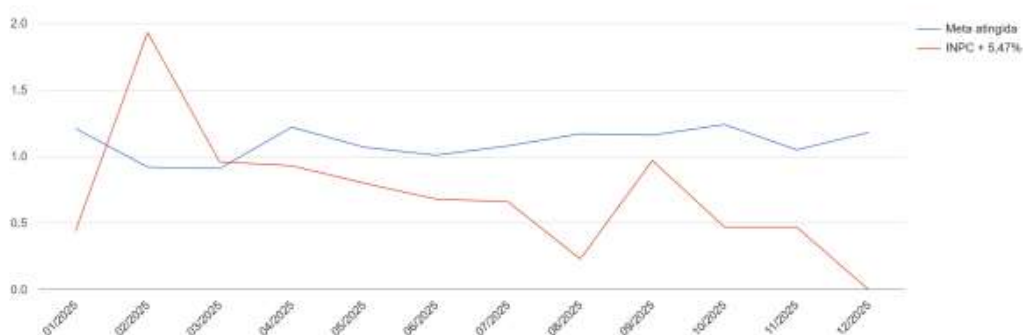
Gráfico - Rentabilidade x Meta (mês a mês)

O gráfico "Meta x Rentabilidade (mês a mês)" ilustra que, ao longo do ano, a rentabilidade obtida pelo Fundo estabilizou, ficando acima da meta praticamente o ano todo, o que se refletiu no resultado final. Essa performance anual acima do esperado mostrou que a revisão das estratégias e das premissas para a política de investimentos para tendo por base o ano de 2024, teve êxito e alinhou as aplicações com as metas atuariais.